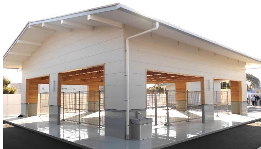
ドッグラン（保護犬用）