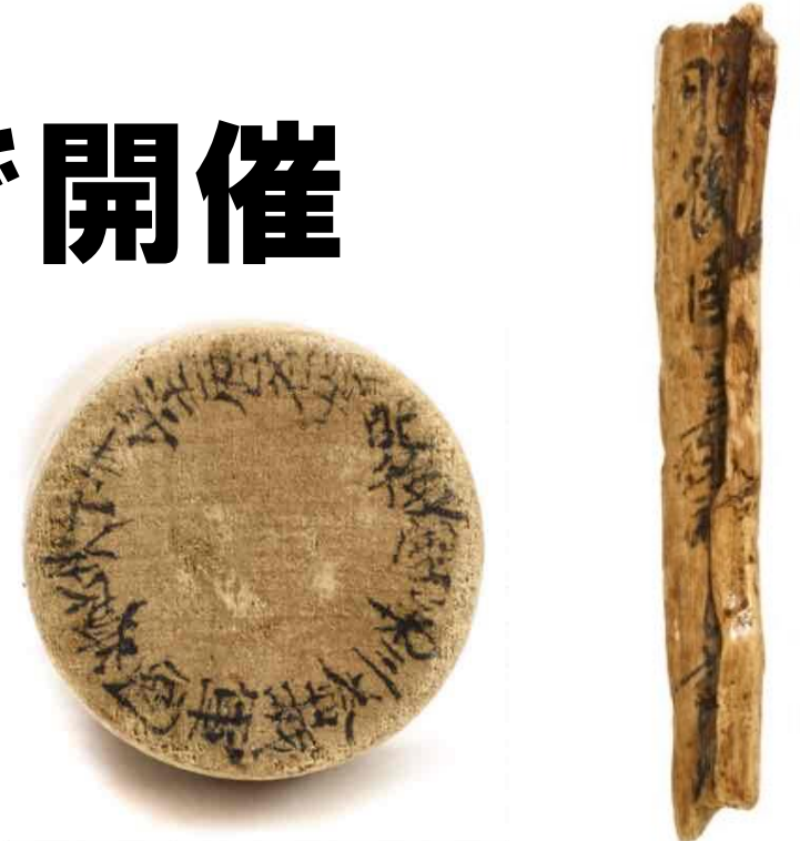
平城宮木簡（奈良文化財研究所所蔵）