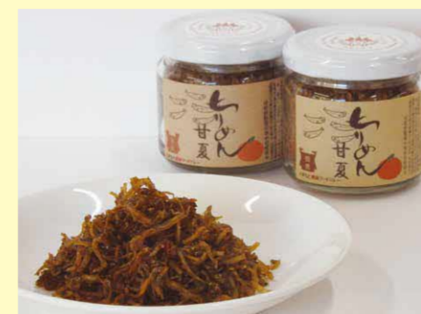
ちりめん甘夏(TSM)(水俣高校企画商品)