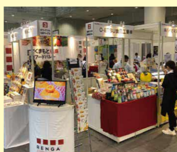
展示商談会の様子