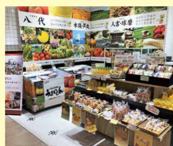
県南産品物産展の様子

大都市圏をターゲットとした販路拡大を進めています。百貨店等における県南産品フェアや、生産者と事業者との商談会を開催します。