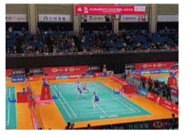
●国際バドミントン大会「熊本マスターズジャパン」

▼ここから下の段は 広告 です。広告の内容については、広告主へお問い合わせください。広告掲載については、株式会社ジチタイドまで。☎092-716-1401