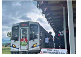
●南阿蘇鉄道全線運転再開記念発車式