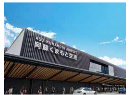
●3月に開業した阿蘇くまもと空港新旅客ターミナルビル

●1月に県と経済団体の代表らが台湾を訪問。8月・9月にはJASM駐在員やその家族を含むおよそ600人が台湾から順次来熊。熊本と台湾の経済団体のMOU締結や交流イベント開催等、さまざまな面で台湾との交流が活発化。住環境・教育などの受入れ環境整備が進む。