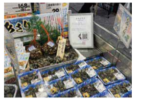
●首都圏で出荷再開した県産あさり