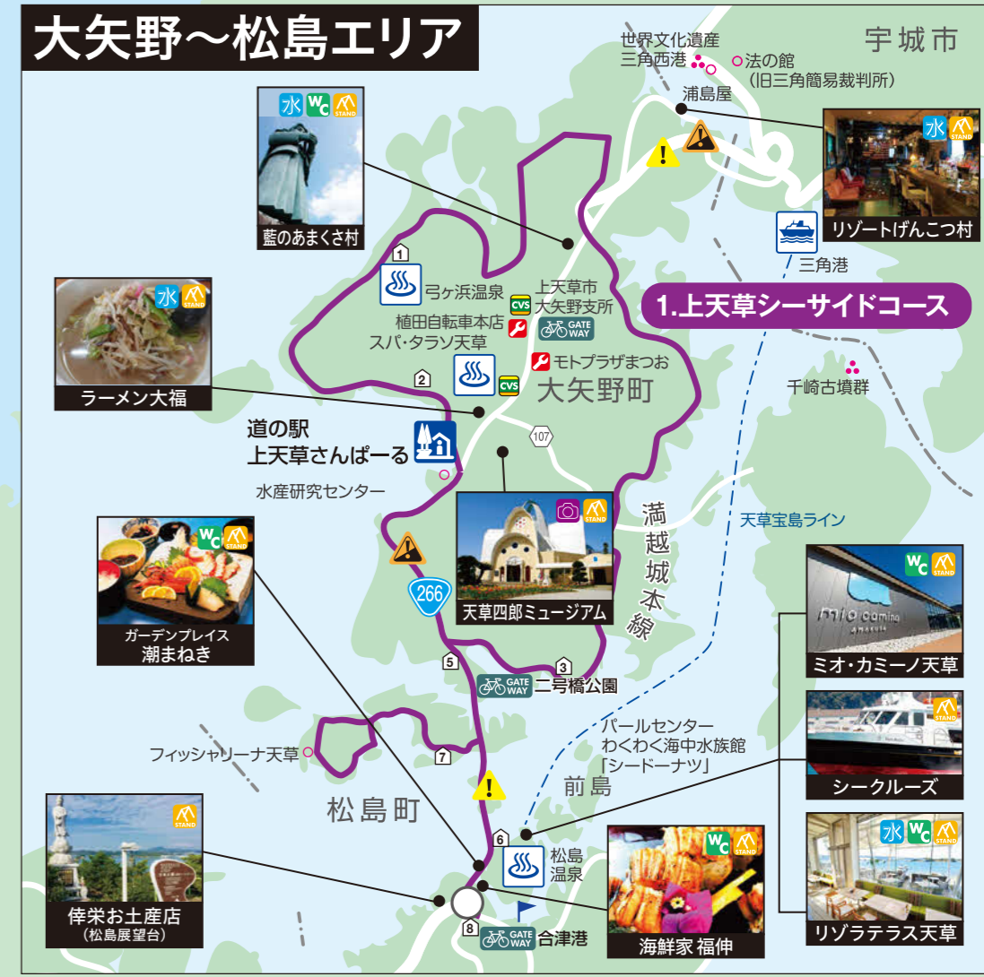
大矢野～松島エリア