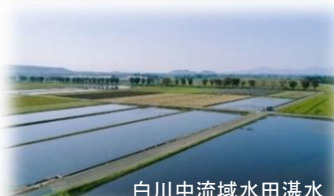
白川中流域水田湛水