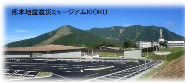
熊本地震震災ミュージアムKIOKU