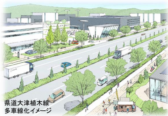
県道大津植木線 多車線化イメージ