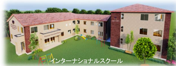
インターナショナルスクール