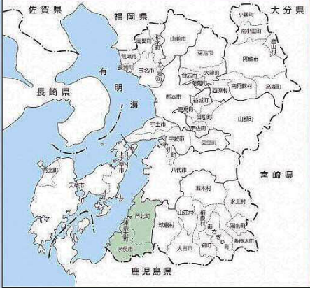
芦北地域振興局管内位置図