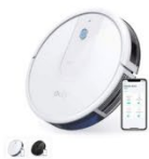
Eufy RoboVac 15C カラー：ホワイト、ブラック

https://www.ankerjapan.com/pages/robovac-support