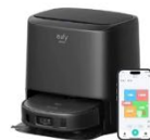
Eufy Clean X9 Pro with Auto-Clean Station カラー：ブラック