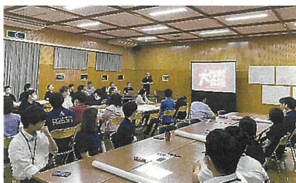
川辺川魅力創造事業に係るワークショップ (R5.9.7)