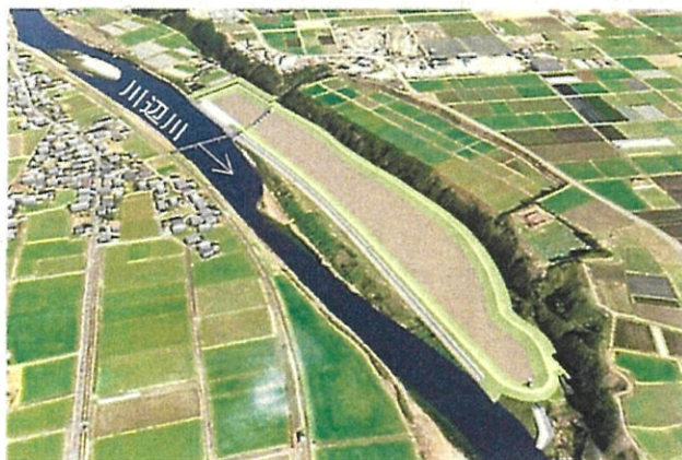
相良村柳瀬地区遊水地事業予定地