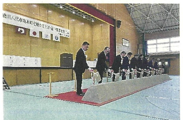
八代市坂本町宅地かさ上げ・輪中堤事業着工式