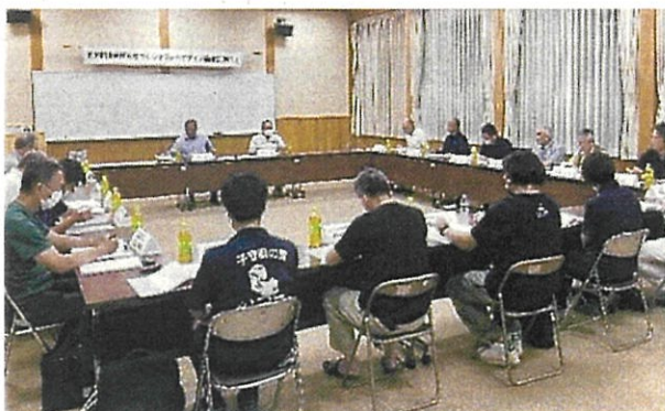
五木村東地区グランドデザイン策定協議会 (R5.9.8)