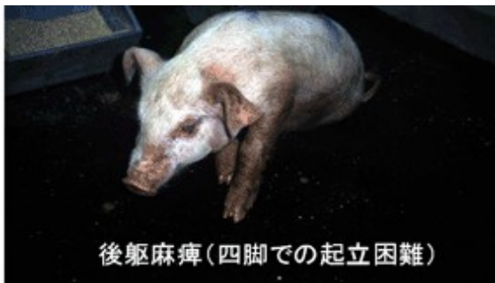
後躯麻痺(四脚での起立困難)