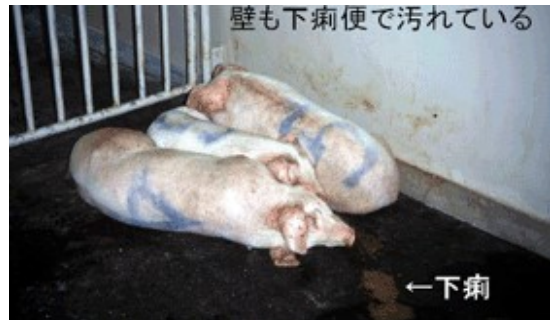
壁も下痢便で汚れている