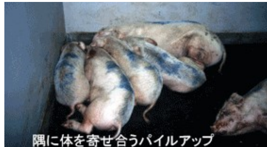
隅に体を寄せ合うパイルアップ