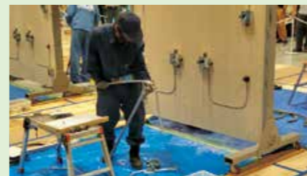
若年者ものづくり競技大会(電工職種)