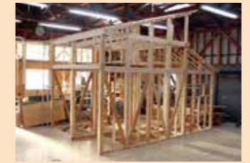
実習課題（2階建住宅）