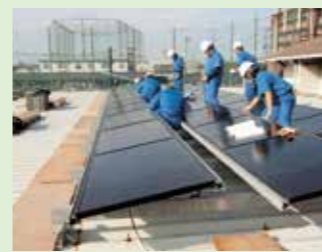
太陽光発電設備(屋上実習)