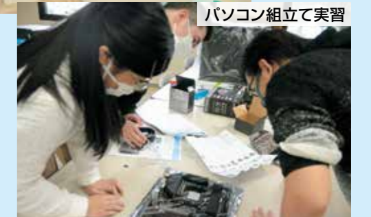
パソコン組立て実習

熊本ソフトウェア株式会社内 障がい者IT職業訓練センター 熊本県上益城郡益城町田原 2081-28 TEL (096) 289-2100