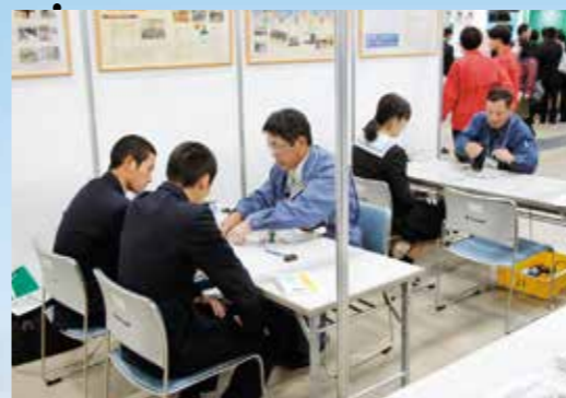
くまもとお仕事探検フェア