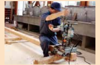
電動工具による加工作業