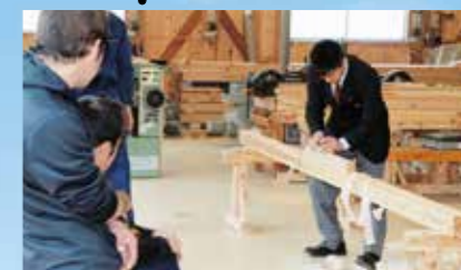
春のオープンキャンパス