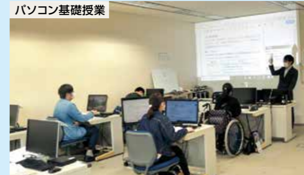
パソコン基礎授業

求職されている方が対象の訓練で、入校後6か月は基礎訓練としてコンピュータ活用に必要な基礎知識の習得やワープロ・表計算ソフトウェア活用実習を行います。その後は希望職種に必要な高度な知識や技術などを習得するために専門性の高い応用実習を行います。(就職率100%)