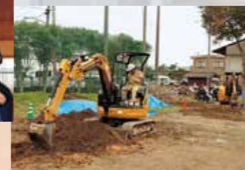
小型建設機械特別教育

入校選考試験 (自動車車体整備科) (電気配管システム科) (総合建築科) 人権同和教育 派遣実習開始 入校選考試験 (総合実務科4月生)