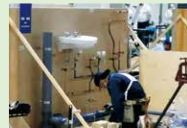
技能五輪競技大会(配管職種)