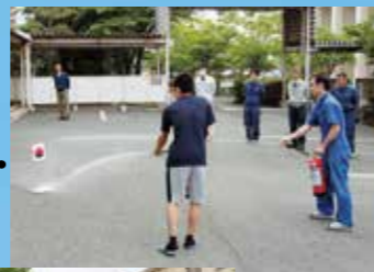
みゆき寮消防訓練