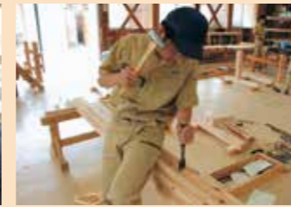
手工具による加工作業