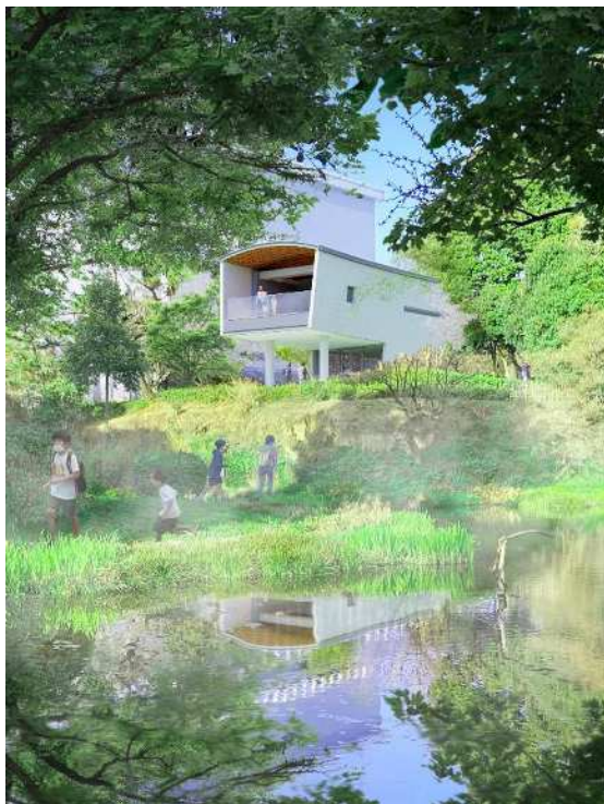
外観イメージ。旧砂取細川邸庭園から見た西側外観。木々に囲まれた建物の2階テラスからは庭園の緑を望むことができる