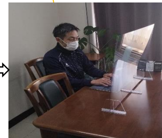
個室に移動してできるようになった