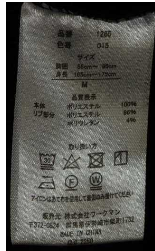
黒色長袖ポロシャツ（サイズM、「WORKMAN BEST」）