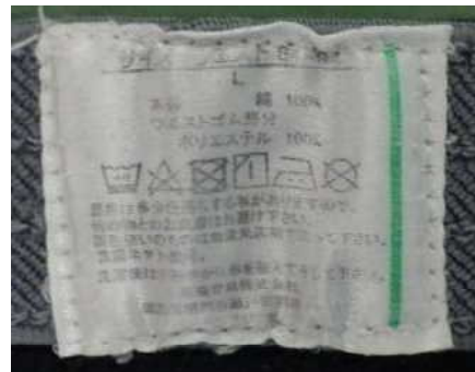
黒色トランクス（サイズL、黒地にトランプのマーク）