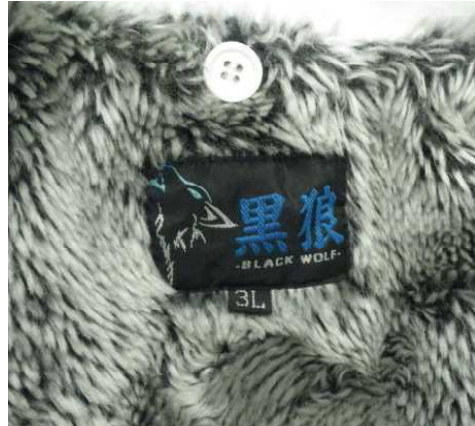
白色ジャンパー（内側は灰色、サイズ3L、「黒狼」）