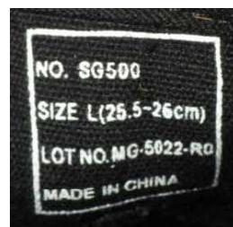
黒色スニーカー（サイズL、25.5～26.0、「DIAMAGIC DIRECT」）