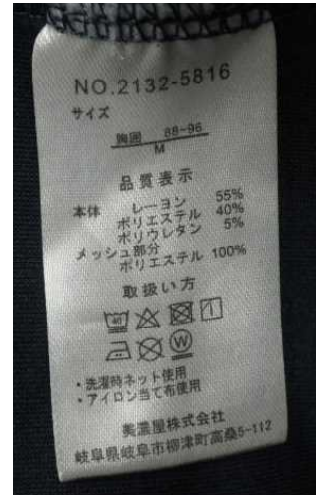
灰色トレーナー（サイズM、「CL.T motion」）