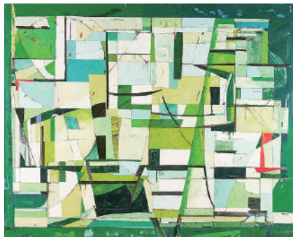
藏本朝美《田園》本館收藏

從細川家家傳的美術品中，選出具有華麗描金畫的馬鞍、女性服飾和婚禮用品等來展出。此外，還會從今西收藏品中選出平田鄉陽的人偶、熊本出身的漆器藝術家高野松山及增村益城等人的作品來展示。並以於2022年度新收集而來的美術品為主軸，來介紹熊本戰後美術的發展過程。