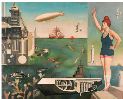
古賀春江《海》東京國立近代美術館藏

東京國立近代美術館自開館以來約70年一直牽引著日本美術界，而本展則會以其館藏為中心，展示包含2件重要文化財在內的76件西洋繪畫和雕刻作品。來場者將能藉由作品，了解近代日本在輸入了「美術」概念和文化之後，一邊與相繼被介紹進來的西洋美術及日本社會等搏鬥的同時，一邊拓展出新興表現手法的日本近現代美術發展過程。