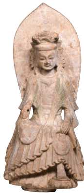
國家指定文化財 《石造菩薩半跏像》 中國北魏時代（6世紀） 永青文庫收藏

一次展出細川收藏品中的石佛像、金銅佛像之優異作品。還會一併介紹將作品搜集來的細川護立那極高的審美觀、於搜集過程中遭遇的人們和事蹟，及其和友人那被比喻為岩石或金屬的深厚羈絆。