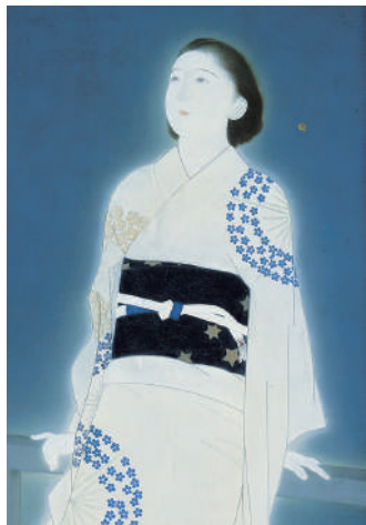
北野恆富《星》大阪市立美術館藏

於1936年開館、歷史悠久的大阪市立美術館，是繼東京和京都之後的全國第3間公立美術館。其館藏種類橫跨日本及中國的繪畫、書跡、雕刻、工藝品等，件數更多達8500件以上，而本展則會從中精選約150件優異作品來做展出和介紹。此能將於大阪市立美術館也未曾同時展示過的知名作品一次欣賞的珍貴展會，在西日本只會於熊本舉行。