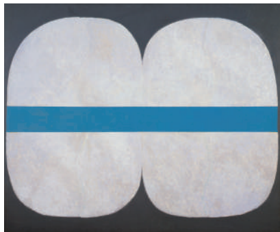
坂本善三《作品（一）》本館收藏

在第1室、第2室介紹和細川家及熊本有關聯的近世繪畫、特別是以前屏風畫為中心介紹。並於第3室展出坂本善三等和熊本頗具淵源之藝術家所經手的繪畫等作品。請著眼於作品展現出的「令人在意的外型」，並從「外型」開始讓想像力恣意馳騁、享受鑑賞樂趣。