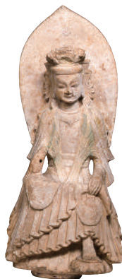
国家指定重要文物 《石造普萨半跏像》 中国北魏时期（6世纪） 永青文库收藏