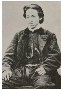
《土方岁三肖像》 1868年

本展以位于东京日野市的土方岁三资料馆的收藏品为中心，介绍跨越动荡的幕末维新时期（江户时代末期-明治维新时期）的“新选组副长土方岁三”的轨迹。并借此机会展示永青文库收藏的肥后熊本藩记录的相关“新选组”的古文书等。实际上，熊本藩曾在新选组屯所所在的壬生寺附近设置阵营，担任过京都警卫，并且熊本出身的新选组队员们曾在此大展身手，然而了解这段史实的人并不太多。本展也将揭开这些不为世人所知的有关熊本藩和新选组的历史。