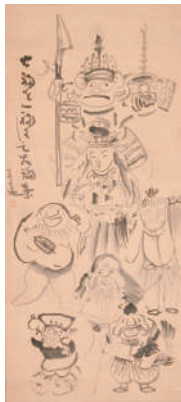
仙厓义梵 《七福神图》 永青文库收藏

本展将介绍永青文库的白隐和仙厓的禅画。众多作品的画风平易近人，完全让人感受不到宗教式的古板。画中充满哲理，蕴含着不禁发人深思的要素。敬请细细欣赏品味。