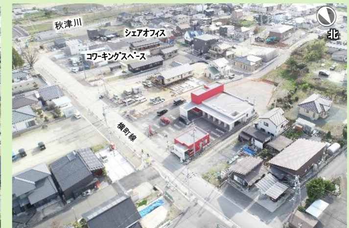
写真6：宮園地区（R5年3月）

宅地造成や道路、上下水道が整備され、建物の再建も着実に進んでいます。引き続き、権利者の皆様への説明を丁寧に行って、復興まちづくりを進めていきます。