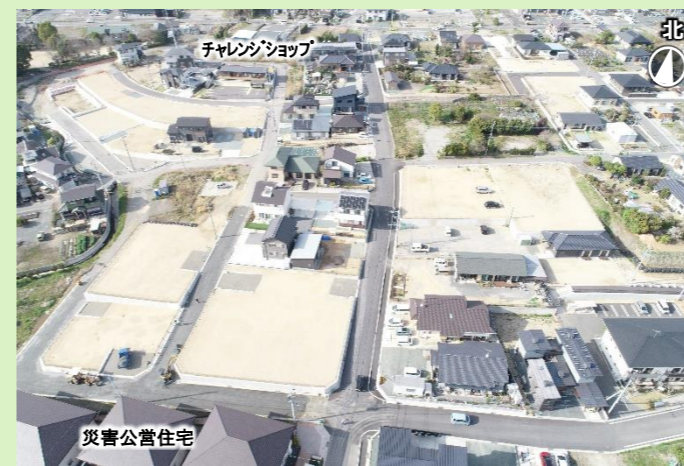
写真5：宮園地区（R5年3月）