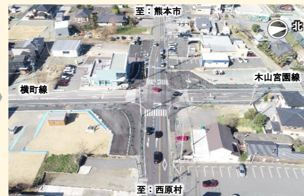
写真4：木山交差点（R5年3月）

県道熊本高森線「木山交差点」を令和4年12月28日に暫定供用しました。本交差点は、歩道がなく危険なうえ、慢性的な渋滞が発生していました。益城町役場新庁舎の供用に伴う更なる交通量の増加が見込まれたことから、右折専用レーン設置及び歩行者滞留空間を確保する暫定整備を行いました。その結果、渋滞が軽減され、歩行者の安全性及び地域の利便性が大きく向上しました。