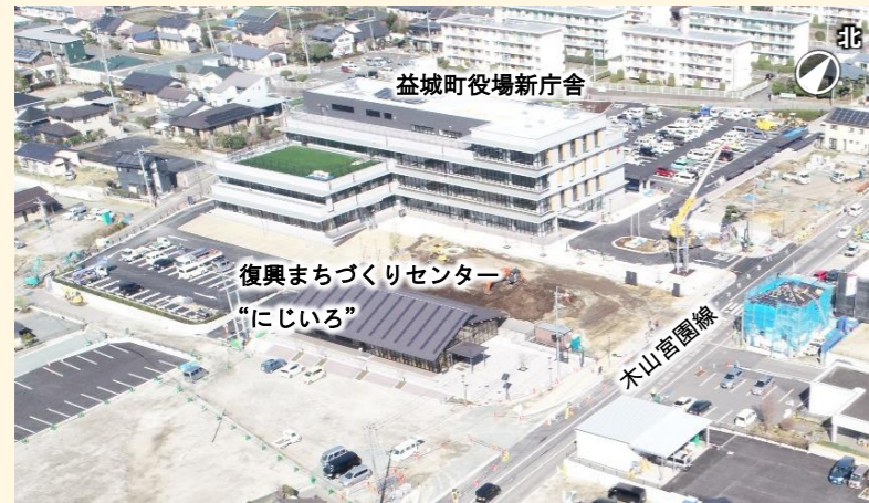
写真1：益城町役場新庁舎周辺（R5年3月）

令和2年度から工事を進めていた益城町役場の新庁舎建設工事が完了し、令和5年5月にオープンします。新庁舎の供用によって、防災機能が強化されるとともに、町民の皆様にわかりやすい行政サービスの提供や多くの方々が集う地域の都市拠点となることが期待されます。（令和5年3月28日に落成式開催）