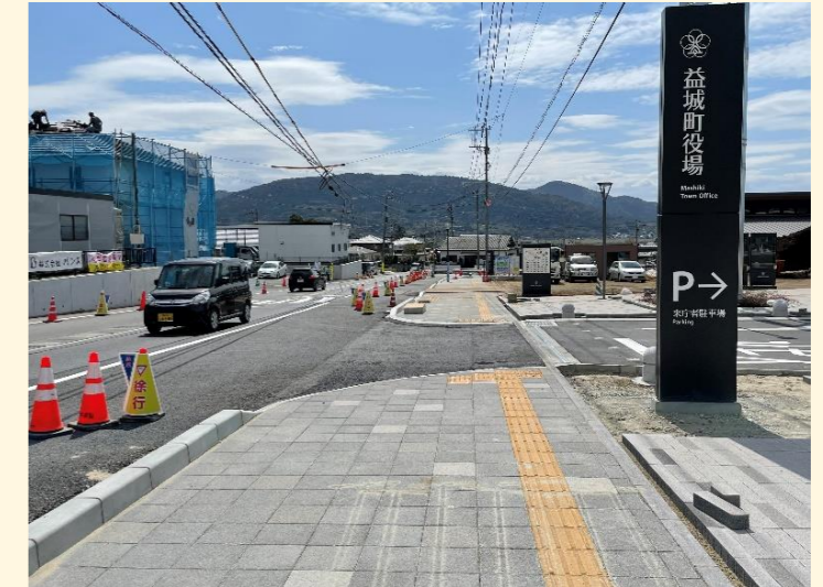
写真2：木山宮園線（R5年3月）