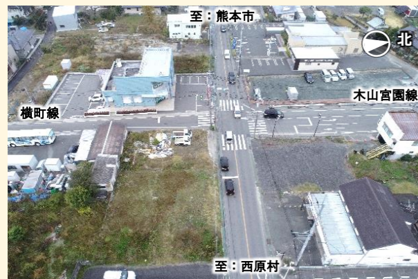
写真3：木山交差点（R1年12月）