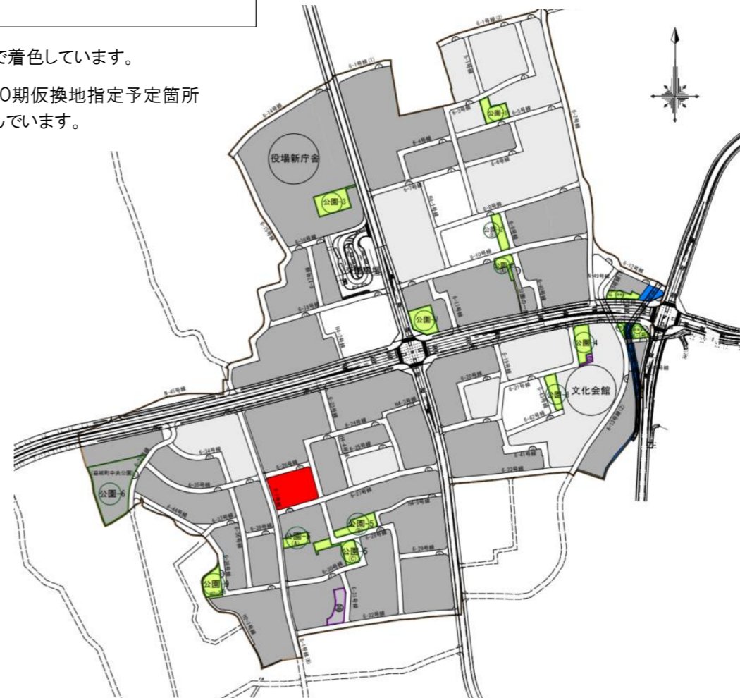
図1 第10期仮換地指定 予定箇所図