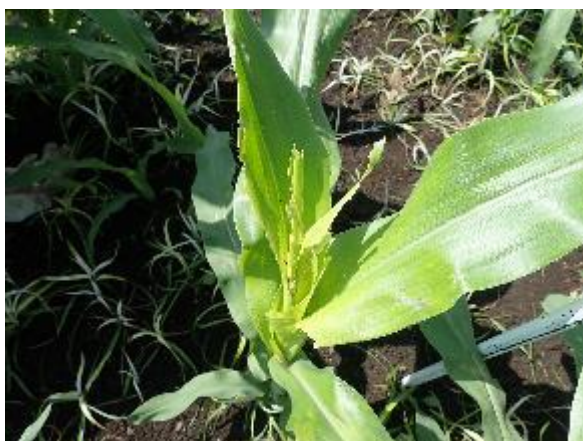
図2 飼料用トウモロコシの被害株