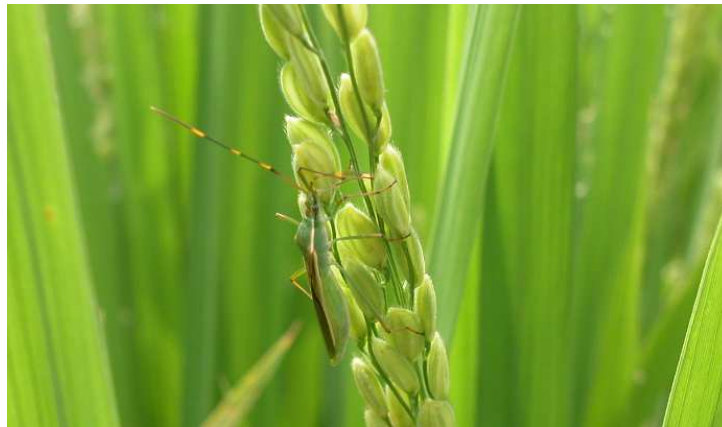
写真1 クモヘリカメムシの加害状況

熊本県病害虫防除所 (熊本県農業研究センター生産環境研究所 病害虫研究室 予察指導係) 担当：山口 TEL 096-248-6490