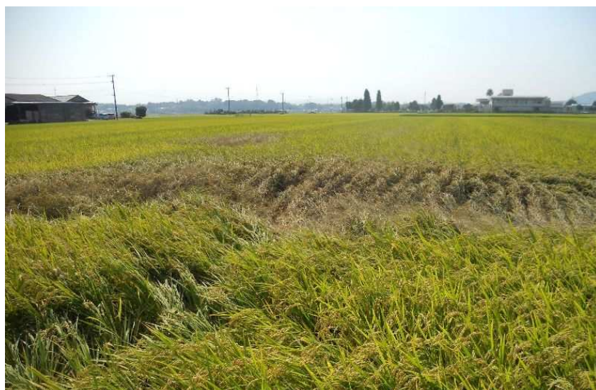
図3 坪枯れの状況 (9月25日撮影)