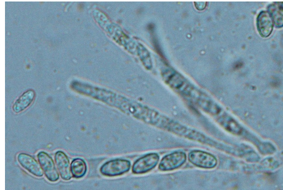
図4 子のうと子のう胞子