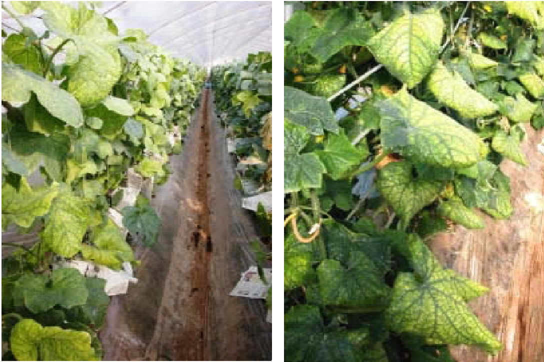
写真-1 メロン（左）およびキュウリ退緑黄化病（右）が発病した現地農家ほ場