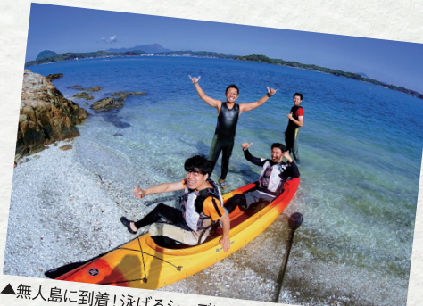
▲無人島に到着！泳げるシーズンはそのまま海水浴もOK

☎090-8356-3577 函上天草市松島町合津6215-17mio camino AMAKUSA 開催時間 シーカヤック9時、13時、SUP10時、14時 雨天時 天草シーカヤックツアー、SUPツアー共に1人8000円※前日までに要予約 函九州道松橋ICより50分 ②270台