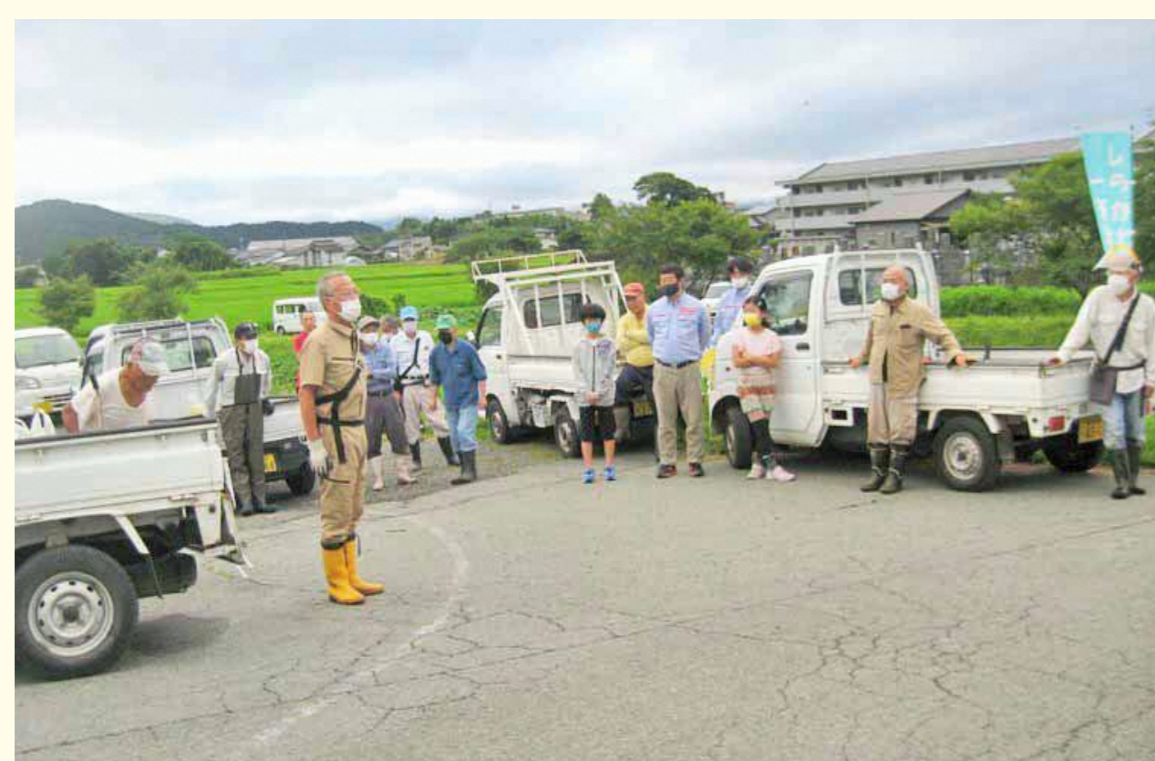
活動に参加された皆さん（中央左が、小嶋会長）