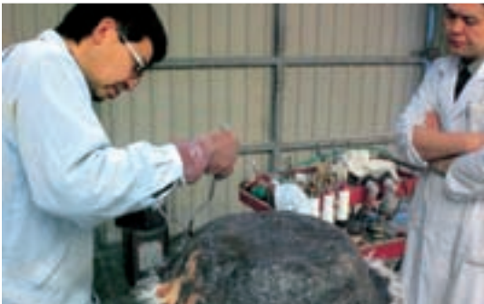
廃FRP (繊維強化プラスチック) を分離して取り出した樹脂とガラス繊維などから再生FRPを試作しています

県内の産業廃棄物の排出抑制、再利用、再生利用、適正処理等に資する研究開発を補助しています。