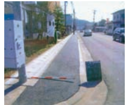
水俣市で整備された歩道

稼働する産業廃棄物最終処分場周辺で市町村が実施する水質調査、周辺道路・歩道の整備、公民館の設置などの周辺環境整備事業を補助しています。