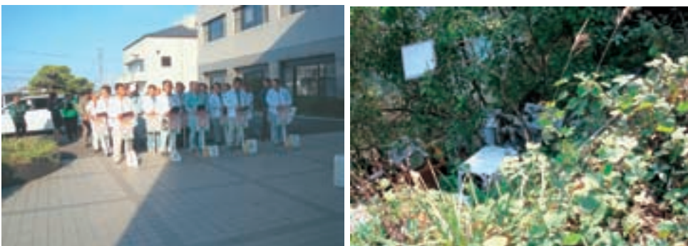
八代保健所管内不法投棄等合同監視パトロールの実施状況

不法投棄等に関する情報提供の締結団体等、県民とのパートナーシップのもと、県民総ぐるみによる取組みとして、通報・連絡体制の整備、不法投棄を未然に防止する地域づくりなどを推進しています。