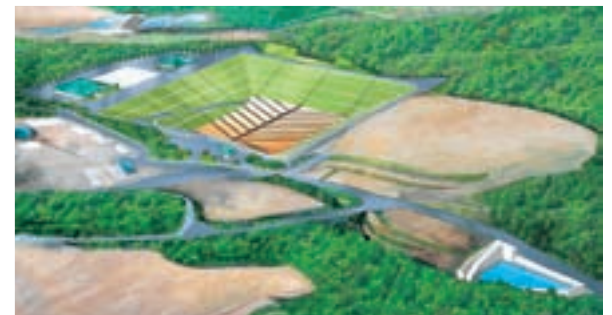
平成20年9月に策定した基本設計による施設イメージ図

産業廃棄物管理型最終処分場の安定的な処理体制の確保のため、公共関与による産業廃棄物管理型最終処分場の整備を進めています。現在、玉名郡南関町下坂下での建設に向けて地元説明会や環境アセスメントを実施しています。