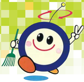
熊本県ごみゼロシンボルマスコット「ゼロッピー」