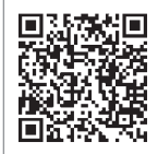
シンポジウム QRコード

どなたでも参加できますが、申し込みが必要になりますので、右のQRコードまたは「熊本県夜間中学シンポジウム」で検索してご確認ください。