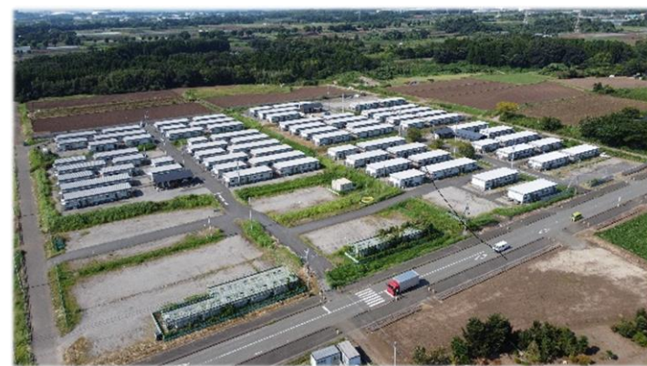
益城町木山仮設団地（令和4年8月現在）