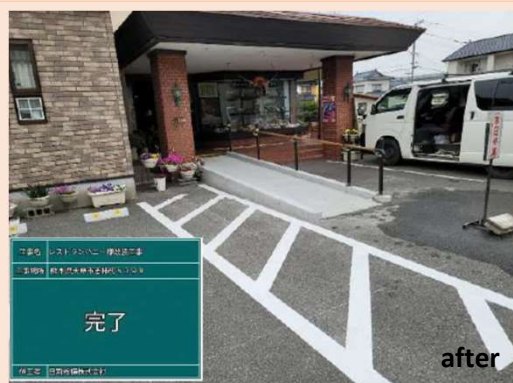
●アプローチの整備 (スロープ・手すり)