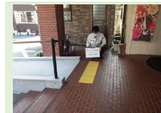
●警告を行うための点状ブロックの敷設