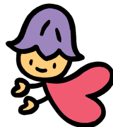
熊本県人権啓発 キャラクター 「ココロ」