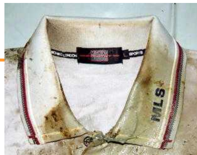
「MITIKO LONDON 製」