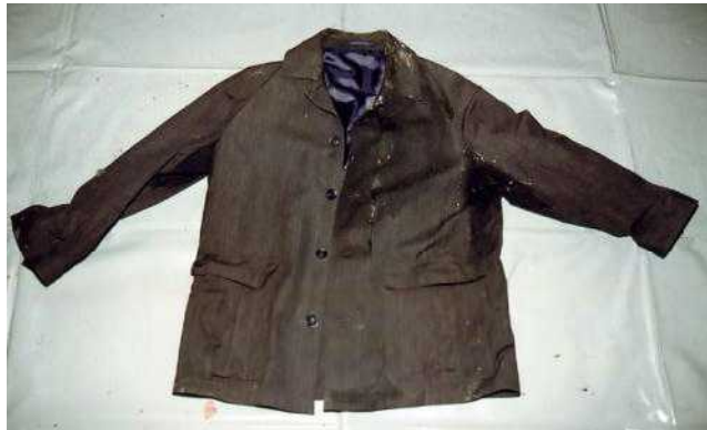
紺色ジャケット「APRIMER 製」Mサイズ