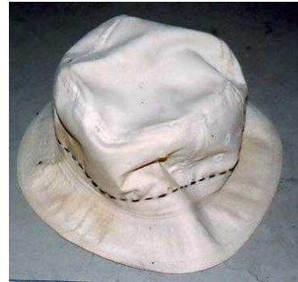
ベージュ色ハット