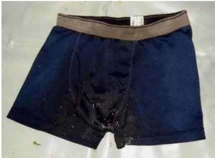
紺色ボクサーパンツ