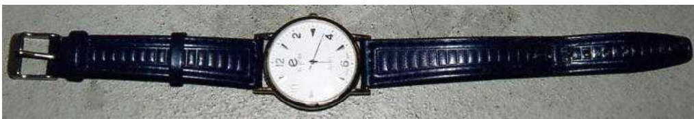
腕時計（メーカー不明 青色ベルト）