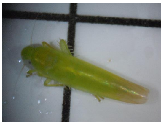
写真1 チャノミドリヒメヨコバイ成虫 (体長約3mm)