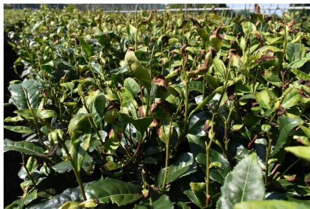
写真3 二番茶の被害 (新葉の褐変・落葉)

熊本県病害虫防除所 (農業研究センター生産環境研究所内) 担当：岡島、福岡 TEL：096-248-6490