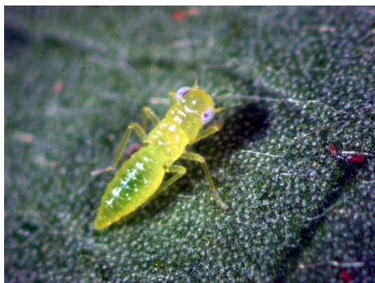
写真2 チャノミドリヒメヨコバイ 老齡幼虫 (体長約2mm)