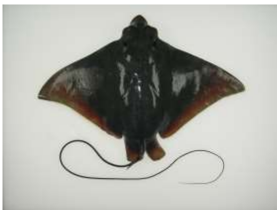
アサリを捕食するナルトビエイ 【浅海干潟研究部】