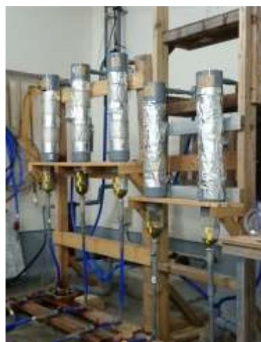
ボトルシステム (クマモト・オイスター中間育成施設) 【養殖研究部】