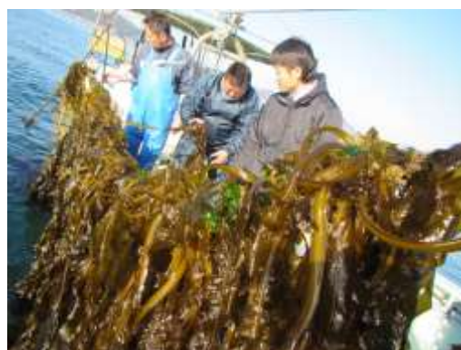
平成29年漁期のワカメ漁獲について 【食品科学研究部】