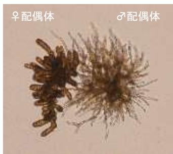
商品性の高い形質を持つ メカブから作成した ワカメフリー配偶体