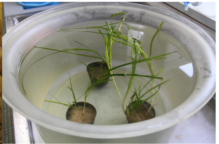
アマモの苗（ポット式）