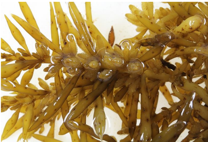
ヒジキの雄性生殖器巢