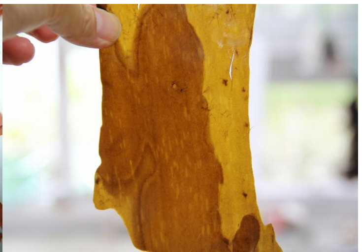
クロメの遊走子嚢