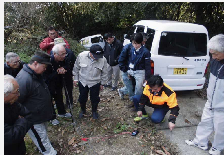
H30.12.12鳥獣対策研修会(現地研修)