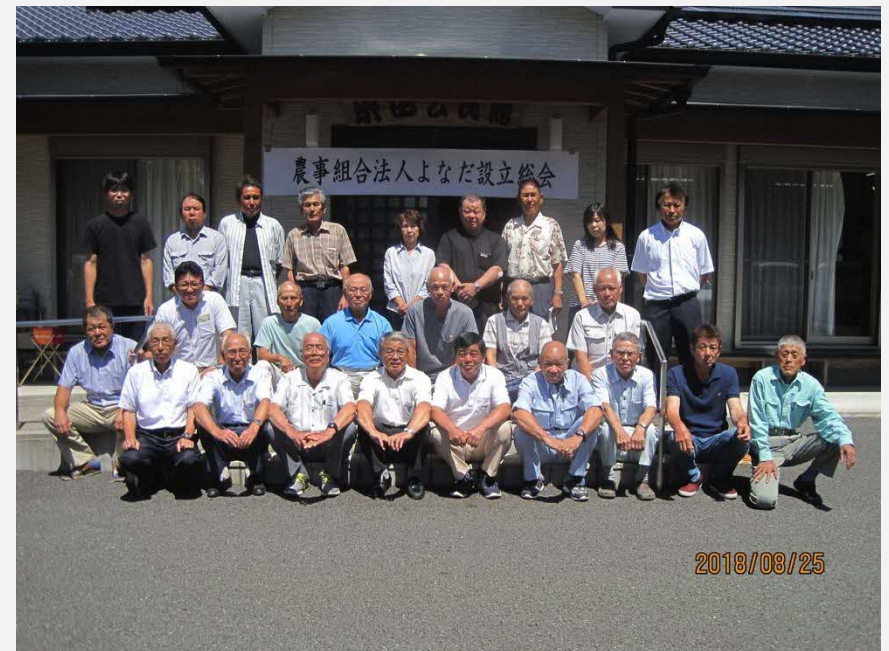
平成30年8月に設立した農事組合法人「よなだ」

もともと米農家同士のつながりが強いという米田の土地柄もあり、「誰がリーダーになってひっぱっていく」というよりも、全員で提案し議論をしていった。このようなことから協力体制は整っていたように思う。