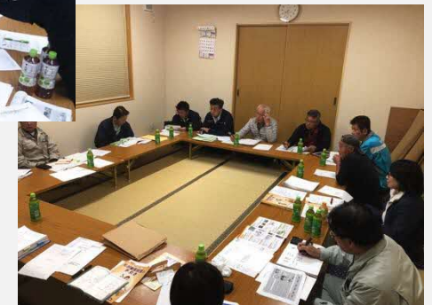
H30.12.18 ビジョン作成検討会