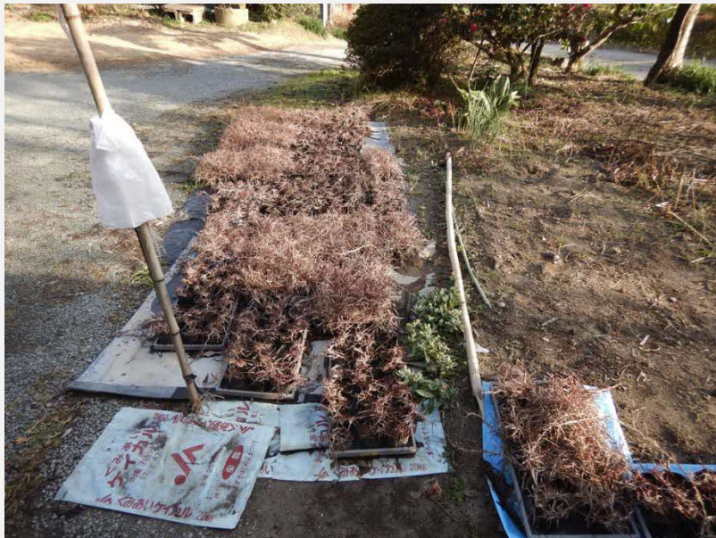
試験的にセンチピードグラスの苗を育成中

現在、3寸鉢300鉢ほどの苗を試験的に育てている。この苗を早ければ令和2年5月から6月あたり、地区でも目立つ場所に50cm間隔で転植し、露地栽培を試みたいと考えている。モデル地区では、春の芽立ちを抑えるために令和元年に防草剤をまいた。