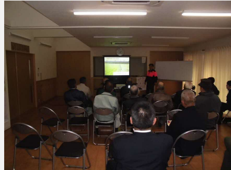
H30.12.12鳥獣対策研修会(座学)

電気柵がされていない箇所は、役員会を開き、その地区の代表の意見を集約しないと難しい。県の補助金と法人で電気柵を設置する話し合いはしている。電気柵については進行形である。