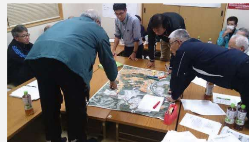
H30.12.6 ビジョン作成ワークショップ