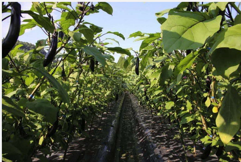
ナスの作付けをスタート