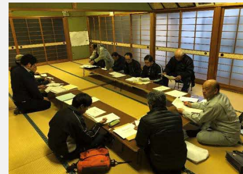
平成30年2月 話し合い組織の設立準備