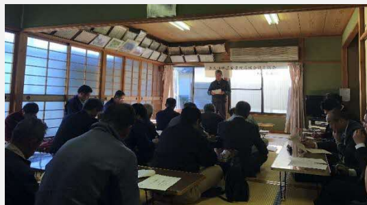
H30.3.23 営農改善組合(話し合い組織)設立総会

その理由として、集落内の農家が比較的若いことが挙げられる。一家の大黒柱として各々の仕事に従事しているため、ビジョン運営のための作業時間が取れず、全体としての意識の統一が難しい。その結果、ボランティア状態で動かざるを得ない役員に大きな負担が掛かっている。協力体制の構築はこれからの大きな課題である。