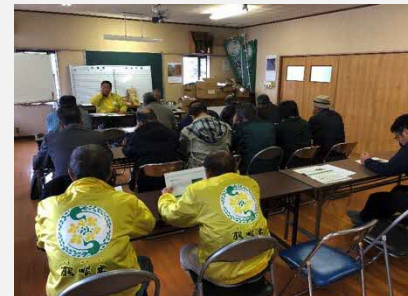
平成29年11月 先進地視察 (八代市坂本町 (農)鶴喰なの花村)

特に鶴喰地区は、五反田地区よりさらに高齢化が進んでいる中で法人化し、活発な活動を展開されている。我々が今後法人化するかどうか、その際にNPOなのか株式会社なのかは未定だが、2、3年後に答えを出すための良い勉強となった。