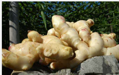
東陽町の全国的に知られるショウガ

トラクターと田植え機の台数を増やして貸し出しによる収益を上げ、役員以外のオペレーター雇用を目指したい。