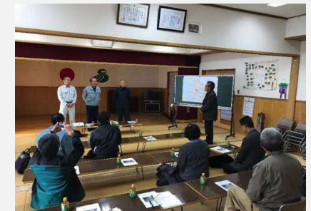
平成29年11月 先進地視察 (鹿児島県薩摩川内市 (農)藤の郷)