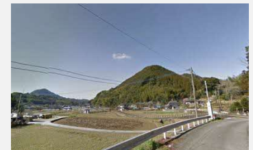
五反田地区の田園風景

水稲からショウガ栽培への切り替えに対して粘り強く説得を行い、5年後を目処に土壌の整備を行っていく。