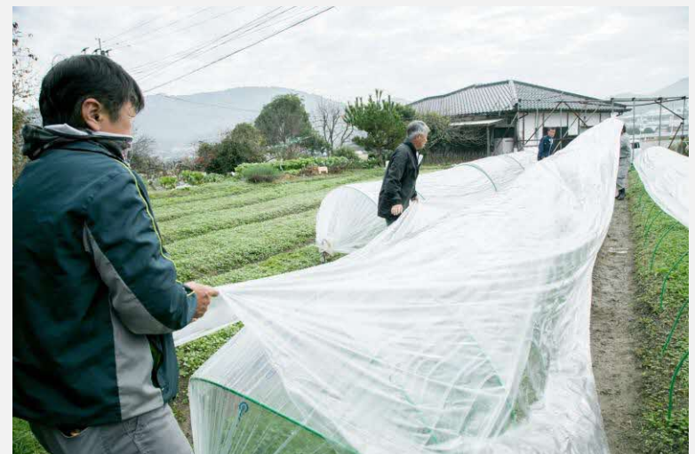
ホオズキの育苗ハウス