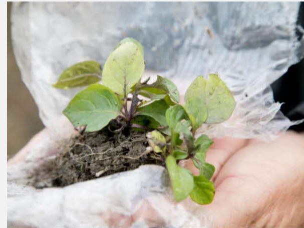
ホオズキの試験栽培

冬の主要作物がないので検討を進める。栗に関しては優良品種の収量増加を狙って「丹沢」の作付けを始めた。筍は、単価の高い早掘り筍を生産できるよう筍園の改良を行っている。