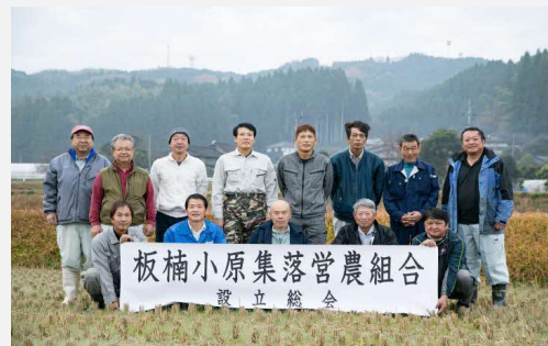
平成30年10月 板楠小原集落営農組合を設立

平成30年10月に、同志会のメンバー15名で「板楠小原集落営農組合」を設立した。中山間農業モデル地区支援事業の農業ビジョンについては平成28年度末に作成したステップアップ事業の農業ビジョンを参考にしながら、今後の活動がより行いやすくなるような内容で作成した。