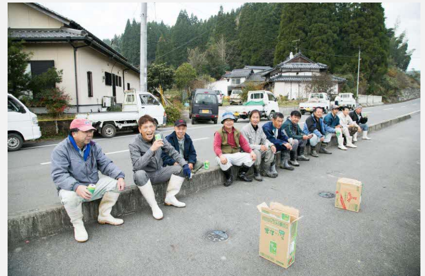
もともと人のつながりが強い板楠小原。 本事業の取り組みを通じて、さらに強いコミュニティへ。

山田錦はヒノヒカリより高単価だが収量が少ない。収益としては上がっていないながらも、“本物の地酒”というブランドづくりに寄与できた実績は大きい。今後も作付けを増やしていく予定。