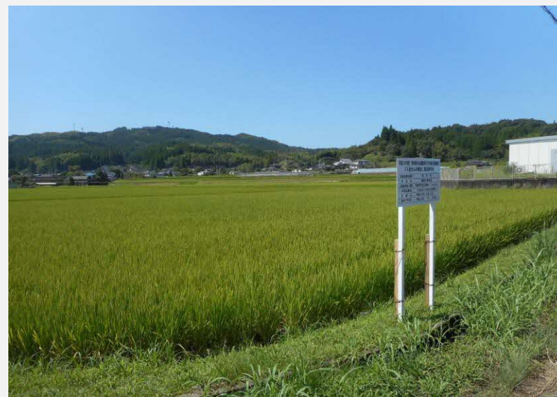
「くまさんの輝き」の実験栽培(15a)

本地区では、地元の子どもの持つ家族に向けて食農教育体験活動と題し栗やナスの収穫活動、採った食材を使って調理実習を行うことで生産者と子供たちの新しいコミュニティの形成を図っている。平成30年度から活動を始めて今年で2年目だが、参加者からは「家族の会話が増えた」「今後も積極的に参加したいという声が上がっており、今後も継続的に活動を行っていく見込みである。