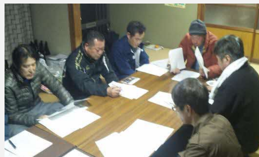
小原公民館での検討会

板楠小原集落営農組合の副組合長は和水町副町長が兼任。副町長は元々県職員で、農業政策にも携わった経験を持つ人物。話が上手で説明が分かりやすく、住民への説明もスムーズに行えた。