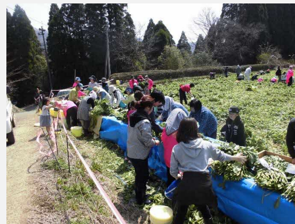
その場で塩もみし、たかな漬けに