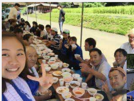
青山学院大学生たちの農家暮らし体験ツアー

地域が存続するためには若い人材が必要であるが、そのためには地域の環境を整備する必要がある。収入の柱を確保しつつ、地域の魅力をアピールしていく必要もある。これら3つのビジョンは集落の人々の共感を得て、合意形成もスムーズに為された。