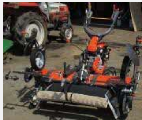
マルチャーなど営農用機械も購入

人手不足が原因なので、害獣対策はすぐにはできない。今後も、優先順位の高い事項に人手を回す。