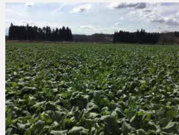
特産の高菜畑が広がる下切集落

課題は多いが、これまでのところ、事前に想定されていた課題以外に発生した新たな課題はない。したがって、将来像についても現在のところは修正の必要は生じていない。