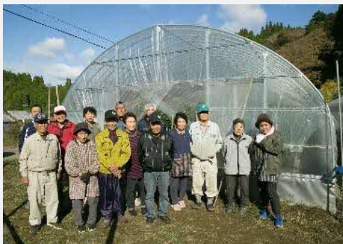
ハウスによるピーマンの作付け。軽くて女性にも収穫しやすく、長期に渡って栽培できる。