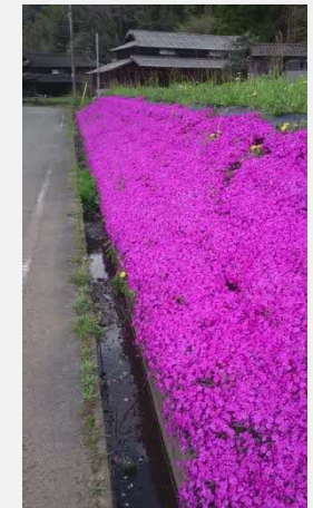
芝桜を植えて景観を美しく

◎景観作物植付(芝桜栽培・芝桜育苗)を平成27年度より活動中。高森町の「花いっぱい運動」で年5万円の活動費が支給。芝桜の育苗だけではなく、定期的な草取りも行う。