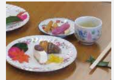
地元の食材でのおもてなし

◎たかなまつりに来た県外のお客さんから「泊まりたい」と要望された。民泊という次のステップの準備になっている。