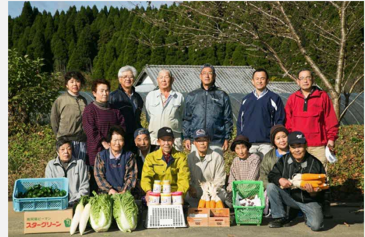
下切自然を愛する会メンバー

平成29年3月より県と高森町から地元への事業説明がスタートし、事前の検討を経た上で、平成29年8月、中山間農業モデル地区に設定された。