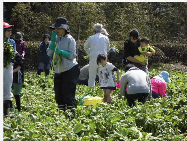
「たかなまつり」でのたかな折り

◎縁側カフェに来てくれたお客さんに販売する土産物として、加工品を1品開発したい。