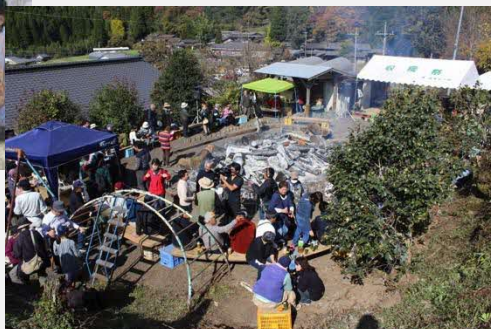
毎年11月に開催される収穫祭 おもてなし隊長・甲斐好夫氏の自宅庭を 開放して開催される