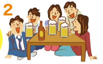
大人数や長時間におよぶ飲食