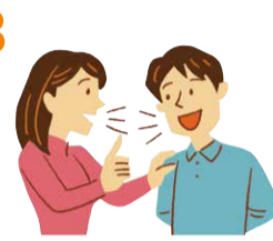
マスクなしでの会話