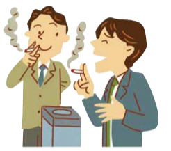
居場所の切り替わり