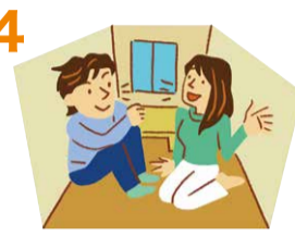
狭い空間での共同生活