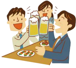
飲酒を伴う懇親会等