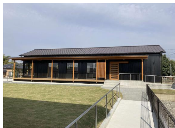
45 街区にオープンしたコワーキングスペース

45 街区では、 コワーキングスペース 及び シェアオフィス が令和3年12月19日にオープンしました。また、 チャレンジショップ は50街区で整備を進めており、年度内に竣工を予定しております。