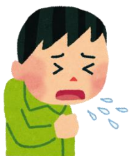
せきが2週間以上続く

せきやたんが出る、微熱が続くなど、結核の症状は風邪によく似ています。結核は、せきやくしゃみとともに飛び散った結核菌が空気中をたどると、それを吸い込むことで感染します。結核にかかっていることに気づかず治療が遅れると、病状を悪化させてしまうだけでなく、知らないうちに周りの人に感染させることもあります。感染した人すべてが発病するわけではありませんが、発病した場合でも、きちんと治療すれば治る病気です。また、患者の経済的負担を軽減させるため、医療費の公費負担制度も整備されています。