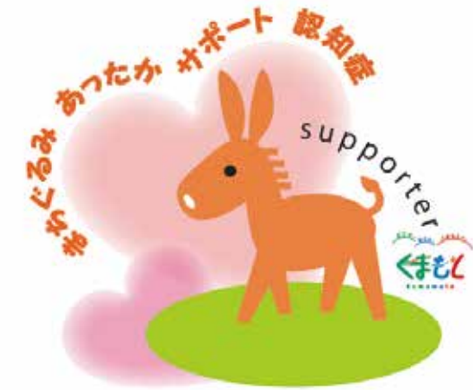
熊本県認知症啓発シンボルマーク