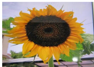
台志市のお家でにっこり