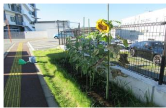
署の空開でこんにはは