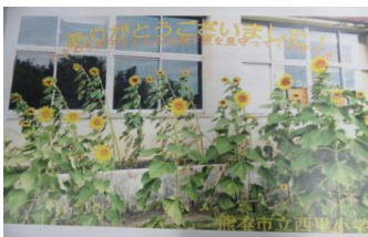
西里小学校では児童を見守り

今年も管内のあちこちで花を咲かせました。北合志警察署と警察署協議会では今後もひまわりを育てることを通じて、命の大切さと交通事故防止の社会気運を醸成していきます。