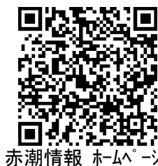
赤潮情報 ホームページ

本県では、本種による漁業被害の報告はありませんが、赤潮の死滅・分解による水質の悪化等により、魚介類がへい死する恐れがありますので、周辺海域でこれらの養殖、蓄養をされている場合は、赤潮の動向や飼育生物の状態に注意してください。