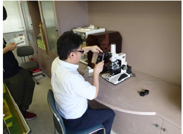
写真2 高倍率の正立顕微鏡の使用を指導 演習状況（海水養殖）