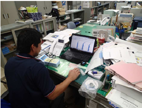
写真3 観測データのグラフ化処理を指導 演習状況（海水養殖）