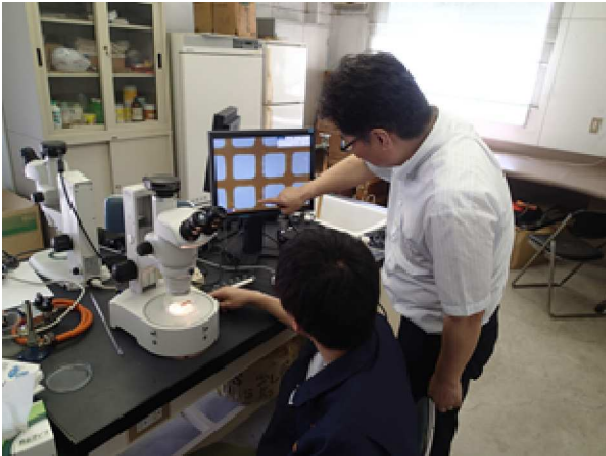
写真1 低倍率の実体顕微鏡を使用（指導前） 小型種の判別が困難（海水養殖）