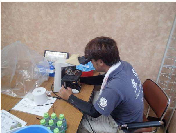
写真5 本渡地区3養殖業者への検鏡指導 顕微鏡の操作、シャットネラの判別が 正確に行われていることを確認