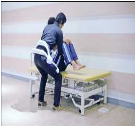
装着型パワーアシスト