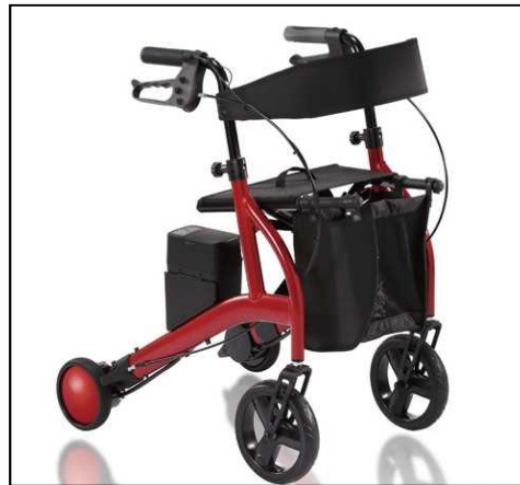
歩行アシストカート