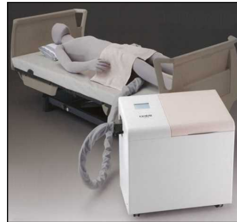
自動排せつ処理装置