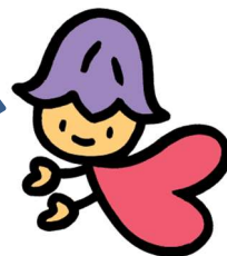
熊本県人権啓発キャラクター コッコロ

派遣する登録講師は、各分野の専門の知識や経験を有し、県主催の研修会等での実績がある方々です。次のような研修へ派遣し、皆様の人権研修を応援します。