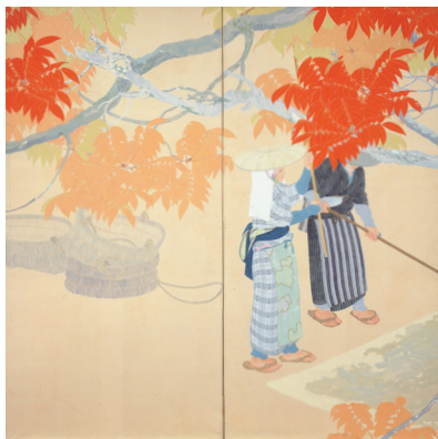
堅山南風《霜月頃》大正2年(1913) 熊本県立美術館所蔵