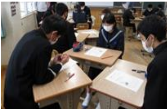
未来予想トークの様子