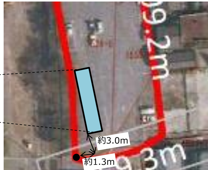
防火水槽設置サイズ(縦方向×横方向) : 10.00m×3.32m