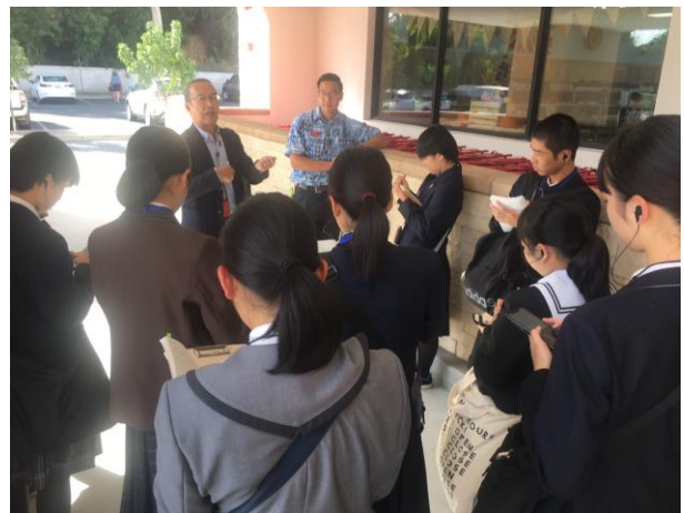
英語でのインタビューに挑戦