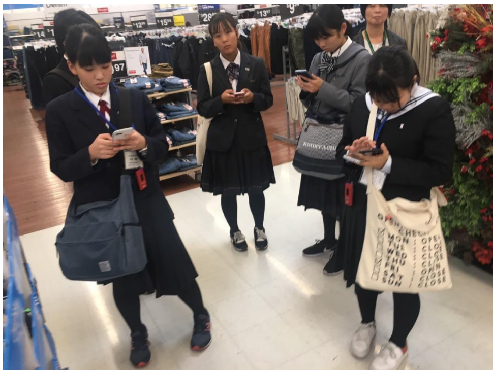
店内の在庫や商品の場所をスマートフォンで把握するシステムを体験