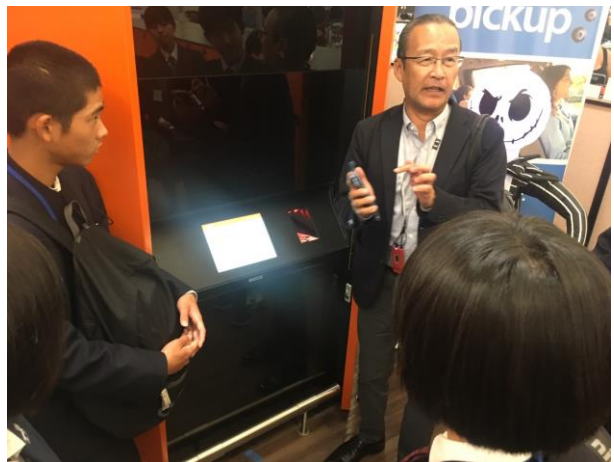
注文した商品スマートフォンを使って受け取ります