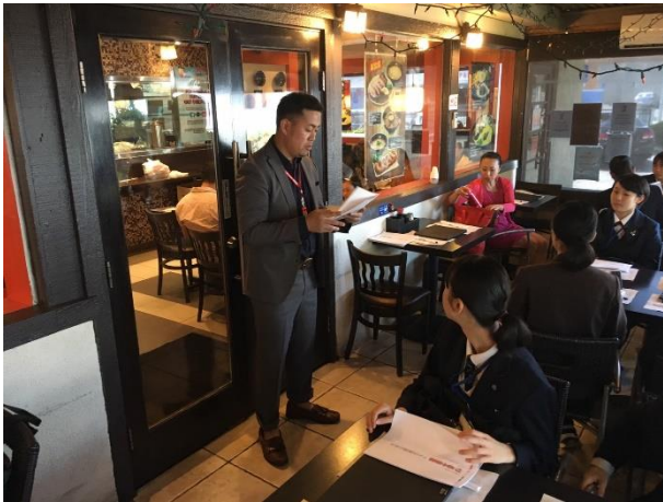
府内 GM の説明