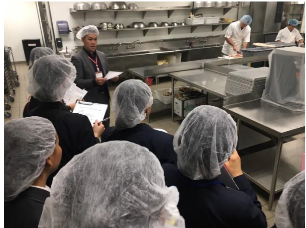
セントラルキッチン